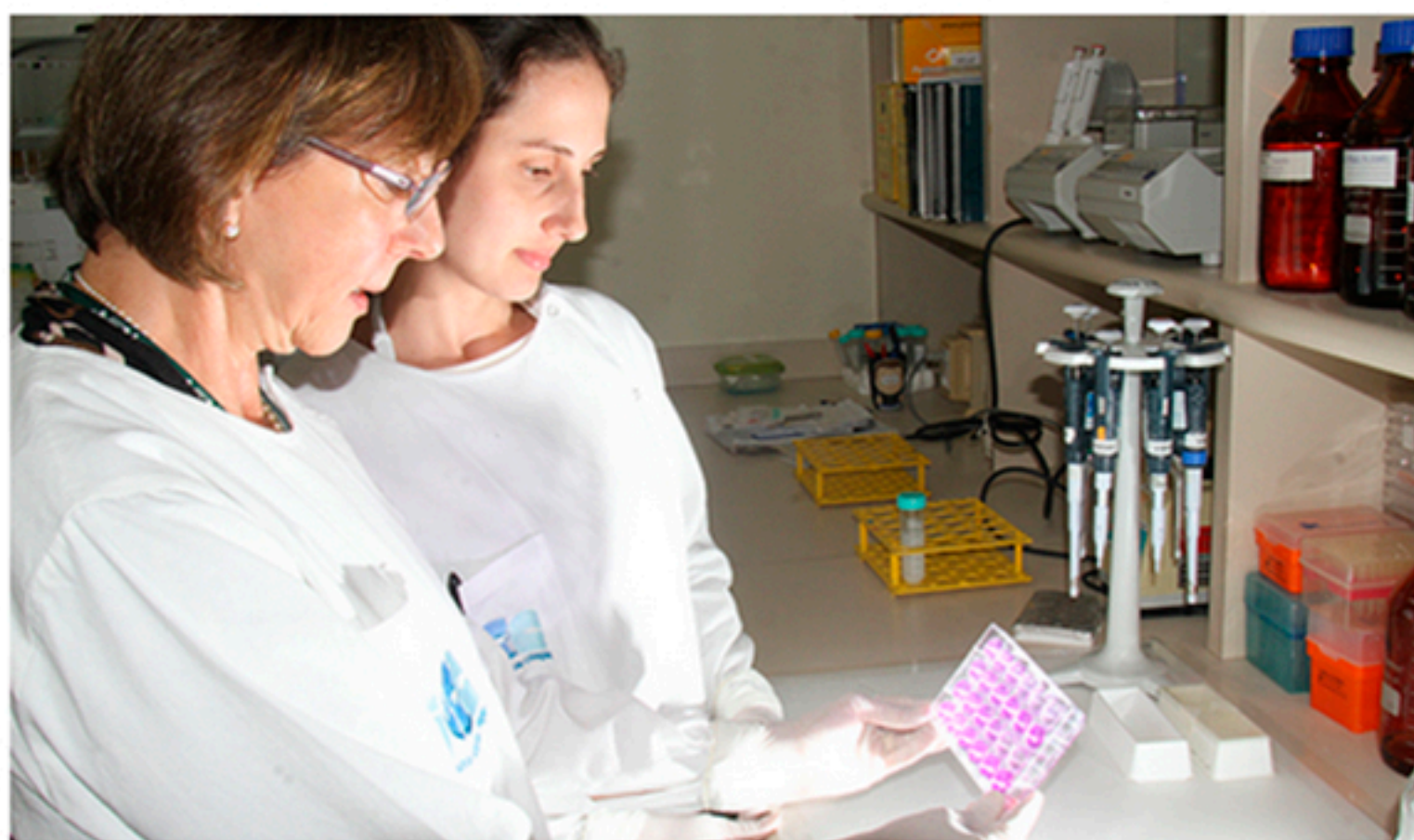
Laboratório da Fiocruz no Paraná: expertise